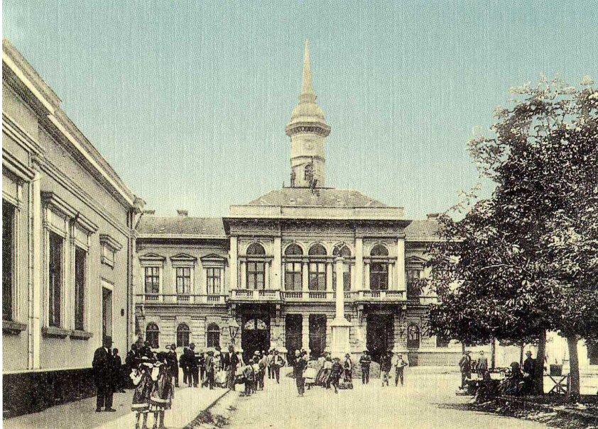
Gradska kuća (1907. godina)

Grad Bečej se nalazi nešto malo severnije od skoro strogog centra AP Vojvodine. Zahvaljujući dobro razvijenoj saobraćajnoj mreži, ravnomerno je povezan sa svim delovima Vojvodine. Drumskim putem je udaljen od: Beograda 130 km, aerodroma Surčin 120 km, Novog Sada 45 km i Subotice 75 km.